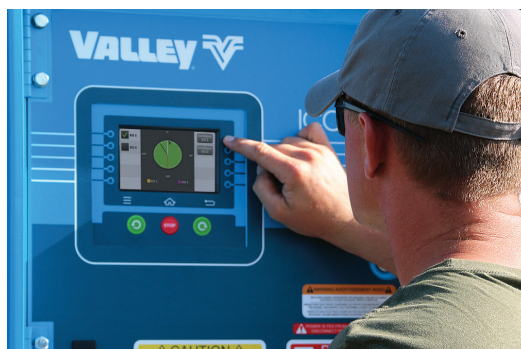
Butoane tactile soft intuitive

Valley ® ICON5 ™ vă aduce în prim plan toate funcțiile din meniuri. Cu simple butoane tactile soft și o interfață tactilă ușor de utilizat la punctul de pivotare, puteți comanda pivotul central cu eficiență și precizie. ICON5 vă oferă tehnologie robustă într-un ecran compact.